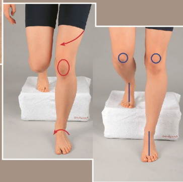
BeWEGungsqualität im Alltag